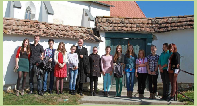
En het internaat in Rupea.